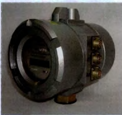
Рисунок 1 – Общий вид блока коррекции объема газа измерительно-вычислительного БК

Блоки выпускаются в двух исполнениях I и II различающихся диапазоном измерений и характеристиками погрешности по каналу измерения температуры и давления.