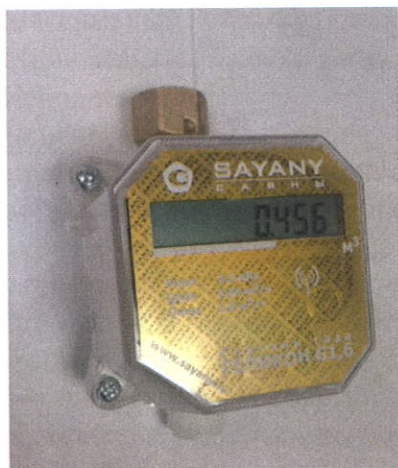
Рисунок 1 - "Геликон п"