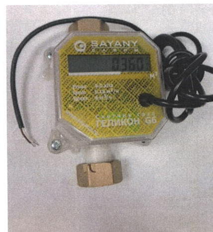
Рисунок 3 - "Геликон п-и"

Счетчик пломбируется разрушающейся наклейкой (Рисунок 4) с клеймом поверителя. Счетчик пломбируется навесной пломбой (Рисунок 5) абонентского отдела.