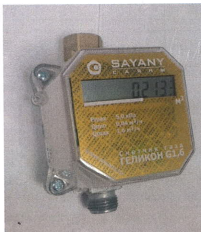
Рисунок 2 - "Геликон м"